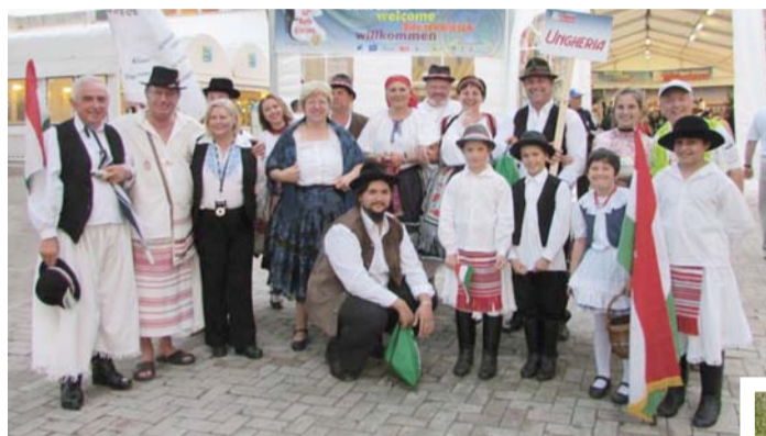
Magyar családok a Velence melletti Cavallino kempingjében. (balra)