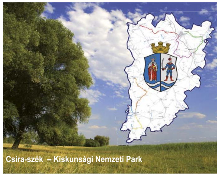
Csíra-szék – Kiskunsági Nemzeti Park

fókuszában a gazdaságfejlesztés áll. Hogyan hangolják össze az egyes elképzeléseket?