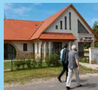
Szentkirály 8. oldal