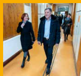
Tiszaalpár 8. oldal