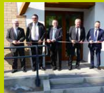
Lakitelek 7. oldal

A legjelentősebbekről a 7–8. oldalon olvashat.