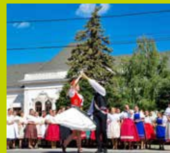
Szabadszállás 7. oldal

A legjelentősebbekről a 7–8. oldalon olvashat.