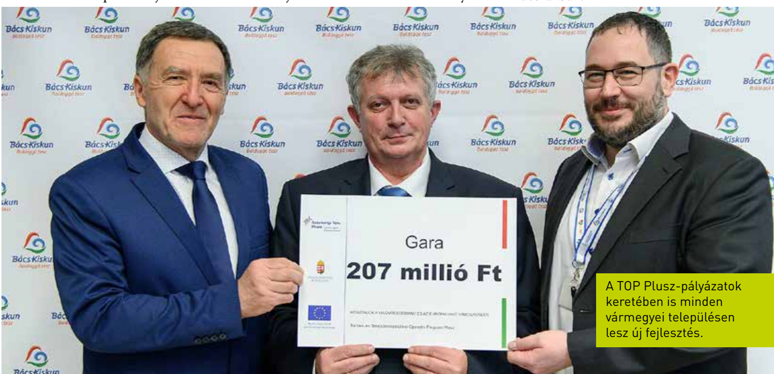
A TOP Plusz-pályázatok keretében is minden vármegyei településen lesz új fejlesztés.

körében, hiszen ezen belül lehet kerékpárútra, csapadékvíz-hálózatra, közlekedésfejlesztési projektekre vagy éppen közösségi terek fejlesztésére pályázni. Azt gondolom, hogy nemcsak az ügynökségnek, hanem az önkormányzatoknak is tekintélyes tapasztalataik vannak már az elmúlt évekből. Ennek köszönhető, hogy gyorsabban és hatékonyabban tudtuk elkezdni ezt az időszakot, és már van befejezett TOP Plusz-projektünk. Ha nem lassul le a rendszer, és ezt a tempót tartjuk, akkor sokkal előbb fognak megvalósulni a tervezett a beruházások, mint az előző időszakban.