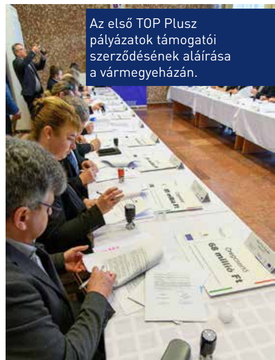
Az első TOP Plusz pályázatok támogatói szerződésének aláírása a vármegyeházán.

A támogatandó területek nagyrészt változatlanok maradtak, még ha más néven vagy konstrukcióban jelennek is meg a felhívásokban. Az „Élhető települések” nevű felhívás például kifejezetten kedvelt az önkormányzatok