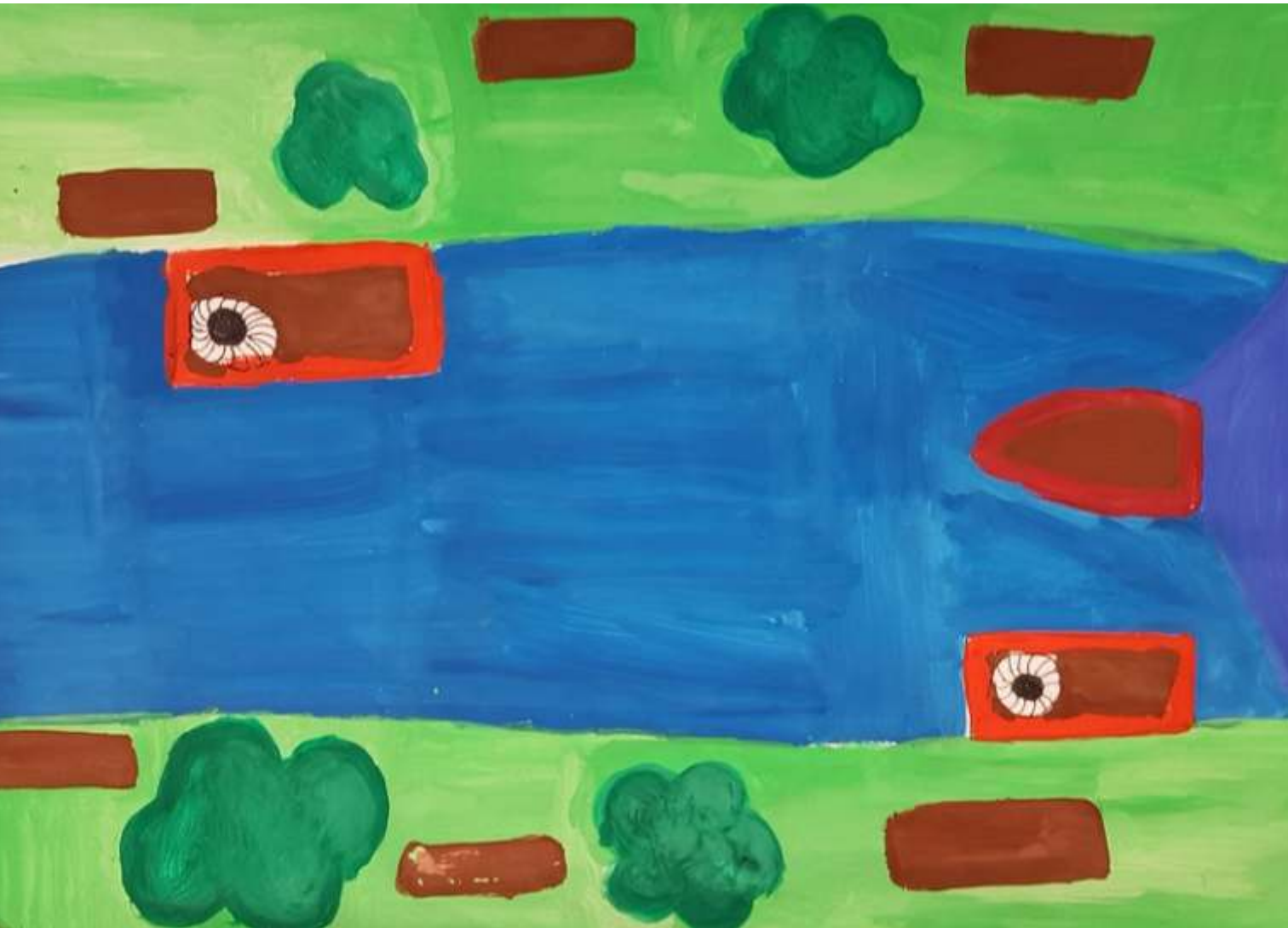
Schloska Petra III. helyezett 10-18 éves korcsoport