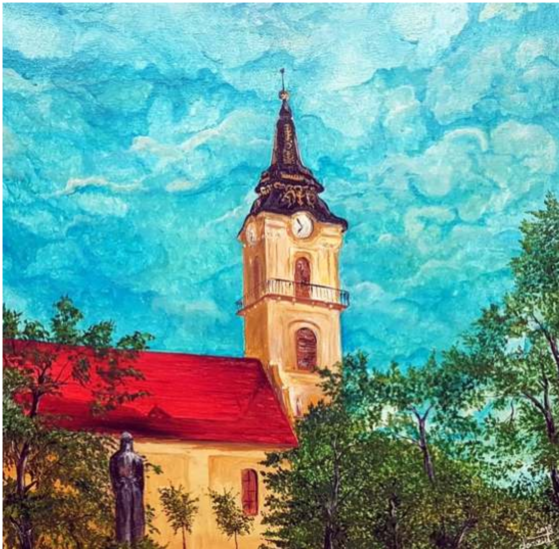
Forgó Lóránt különdíj

19 éves kortól felső korhatár nélküli korcsoport