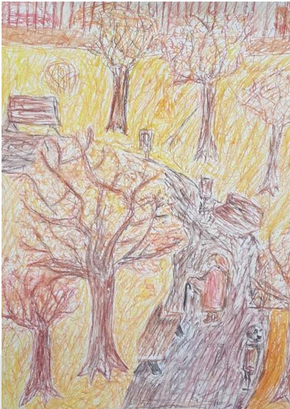
Erdei Judit I. helyezett 10-18 éves korcsoport