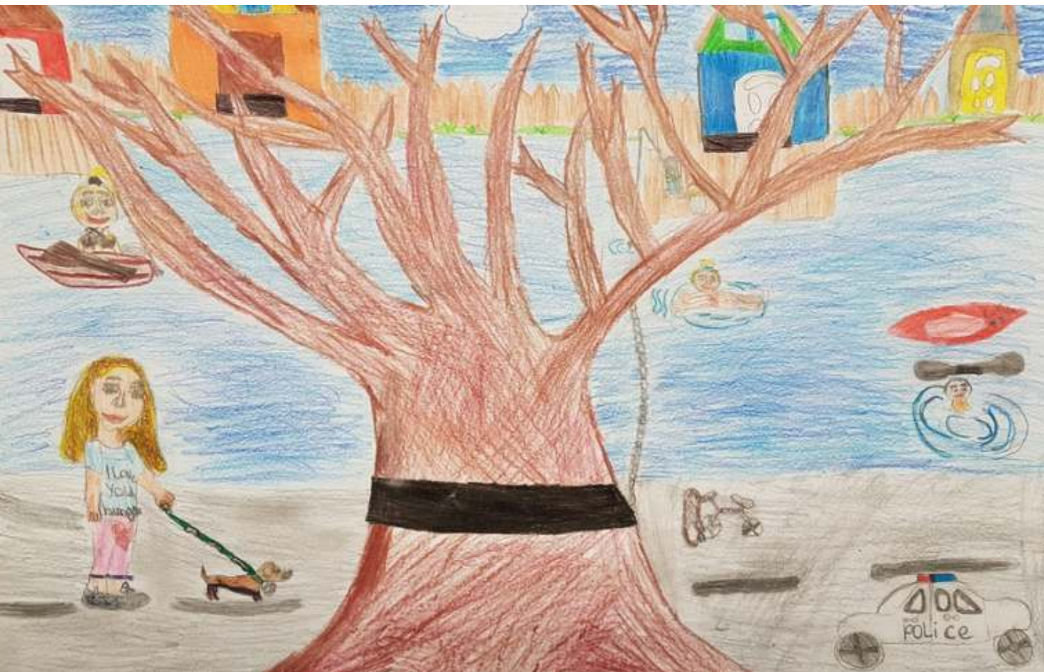
Bécsi Katica különdíj 10-18 éves korcsoport